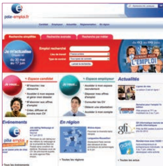
Page d'accueil du site www.pole-emploi.fr

Quelques exemples de CV-thèques : cv.enligne-fr.com , cv.com , cv-theque.fr .